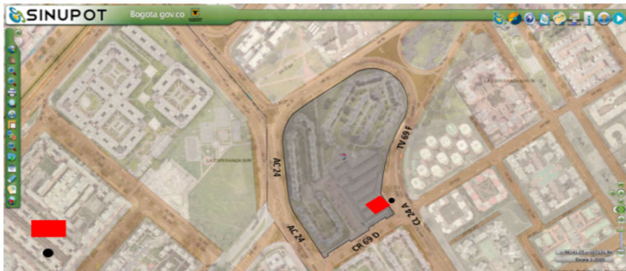
Figura No. 1. Ubicación del predio emisor (TV 69 F No. 24 A - 11) y punto de medición.